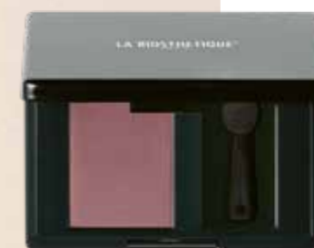
MAGIC SHADOW 50 SMOOTH PINK

Per look lisci e lucidi: Heat Protector , protettivo contro gli styler a caldo