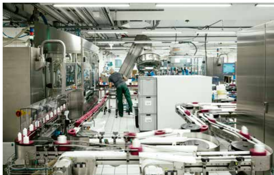
Il sito produttivo high-tech di Pforzheim è stato insignito del marchio GMP, una sorta di Golden Globe per gli stabilimenti di produzione.

Con lungimiranza selezionano i principi attivi, studiano come questi dispiegano la loro efficacia, analizzano come vengono coltivati o ottenuti. E il tutto nel minimo dettaglio. Tutti gli aspetti, infatti, devono convincere. Si tratta di un approccio e di una filosofia che portano a scelte sostenibili, di cui l'azienda è una supporter convinta. Con pazienza, coscienziosità e grandezza imprenditoriale. Forse sembra tutto troppo bello per essere vero. Ma qui le apparenze non sono importanti. Quello che conta a Pforzheim sono i fatti e La Biosthétique ama questo detto. Lo supporta con entusiasmo, e lo fa proprio, in maniera tracciabile.